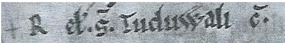
Fig. 3 : Missel de Leofric – Tuduwali